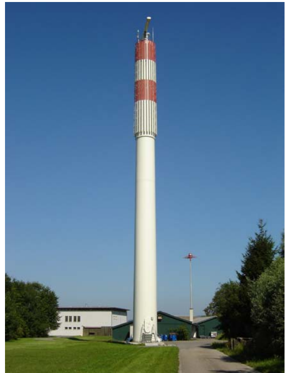
Radarturm Zürich unique

Aus dem oben genannten Grund ist es enorm wichtig, dass alle bedeutenden Einrichtungen wie Radar, Flugfunk, Meteobeobachtungen, Klimaanlage in Computerräumen und Sicherungen o.ä., störungsfrei funktionieren. Deshalb unterliegen diese einer permanenten, elektronischen Überwachung. Diese Kontrolldaten werden zum Teil mittels Glasfasern zum Prozessleitsystem übertragen, welches rund 4'000 lokale und abgelegene Alarmeingänge auf Änderung überwacht. Im Störfall wird der System-Manager (Syma) alarmiert, worauf dieser umgehend die nötigen Massnahmen einleitet. So ermöglicht das beschriebene „Farsight“ System die Sicherheit bei Skyguide nicht nur zu verwalten, sondern ebenso erheblich zu steigern.