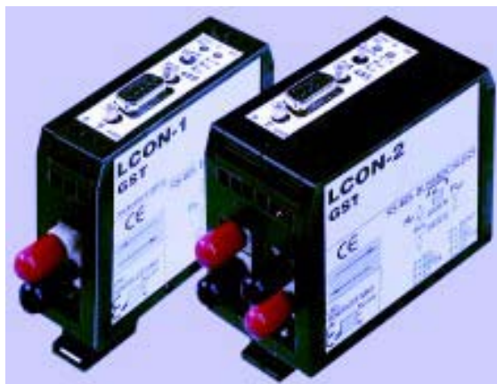
Endgerät (Transceiver): Liniengerät (Repeater)

Diese Familie entspricht allen Anforderungen, welche den Einsatz im industriellen Umfeld fordern. Kleine und auf Hutschienen montierbare Gehäuse mit 24 VDC Speisung. Alle gängigen Schnittstellen wie RS232, RS422 und RS485 mit den meistverbreiteten Protokollen Profibus, Bitbus, Modbus und anderen können für den einwandfreien Einsatz empfohlen werden. Die Erfahrung zeigt, dass auch Ethernet in diesem Umfeld Einzug hält. Daher wurde das Portefeuille mit den entsprechenden Produkten erweitert. Es umfasst einfache Medienkonverter und geht hin bis zu managbaren, redundanten Switches mit extremen Temperaturbereichen von -40^{\circ}\text{C} bis +75^{\circ}\text{C} . barox bietet die passenden Lösungen für individuelle Applikationen.