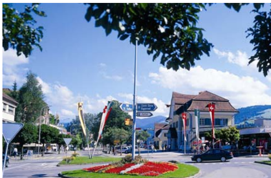
Der Kreisel in Wattwil