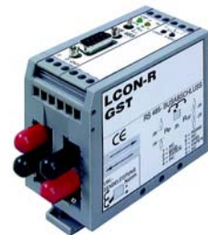
Der eingesetzte kompakte Glasfaser-Wandler LCON-R

Die Glasfaser Wandler LCON-R wurden an die Messgeräte angeschlossen um die Energiedaten über den passiven LWL-Ring blitzschnell zu übertragen. Die Speisung der Module erfolgt über 24VDC; die Montage auf Hutschiene ist sehr einfach. Mittels Profibus können die gemessenen Energiewerte von der Zentrale jederzeit abgefragt oder in Real-time angezeigt werden. Die Ausführung des Projektes erfolgt in verschiedenen Etappen. Die Lösung wurde in Zusammenarbeit mit der Optec GmbH, Bärenswil und der barox Kommunikation AG, Baden projektiert und realisiert.