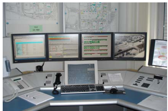
Empfang der Videobilder und deren Auswertung in der BMW Überwachungszentrale

Die TVI Lederer GmbH gewann das von BMW lancierte Audit zur Entwicklung eines Gesamtareal-Video-Überwachungs-Systems aufgrund ihres Erfolgskonzeptes: Installation von wenigen gut platzierten Kameras, bei geringstem Aufwand und optimalem Ergebnis. Genau diesem Grundsatz kommen die Videoübertragungsmodule der Serien V1900 sowie V7000 von barox nach: Präzise positionierbare Kameras, steuerbar mittels intelligenter Software versichern einen geringen Installationsaufwand und eine optimale Arealübersicht. Die übermittelten Bilder sind rund um die Uhr von mehreren Personen gleichzeitig abrufbar. Durch Programmierung der Kameras kann ein vorgegebener virtueller Pfad abgefahren und ein 150 m entferntes Objekt bis zur Identifizierung herangezogen werden. Im Vergleich zur Zwei-Draht-Videoübertragung besticht das LWL-System durch seine enorm bessere Bildqualität. Die Bilder werden bei voller Bandbreite (6,5 MHz) und Bildrate, (25 fps) sowie bei höchster Auflösung (720 x 576) übertragen.