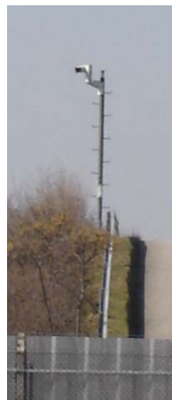
Links: Hoher Sicherheitsbedarf auf dem BMW Areal Dingolfing Rechts: Optimal positionierte Überwachungskamera

Aber nicht nur zur Werküberwachung wird das Videoüberwachungssystem eingesetzt, auch den rund 22'000 Beschäftigten soll das Sicherheitsnetzwerk Schutz bieten, beispielsweise vor Fahrzeugdiebstählen. Ebenso kann ein gut ausgestattetes Videoüberwachungssystem Einfluss auf die Verkaufszahlen nehmen. Denn immer wieder registrieren die Hersteller nach Erscheinen erster Fotos eines neuen Modells einen Verkaufsrückgang beim noch aktuellen Typ. Autoproduzenten müssen deshalb die Prototypen vor den neugierigen Blicken der Auto-Paparazzi zuverlässig schützen bzw. unerwünschte Eindringlinge effizient aufspüren können.