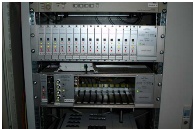
V1900 und V7400 Module im Einsatz bei BMW Dingolfing

Mit der Einführung des Video-Systems von barox wurde bei BMW Dingolfing die Grundlage für die Implementierung künftiger intelligenter Softwareinnovationen geschaffen. Das Glasfasernetz übermittelt erfasste Bilddaten in Hochauflösung ohne Datenverluste an die Systemzentrale, wo sie analysiert werden.