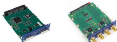
Carte enfichable DVI Carte enfichable SDI